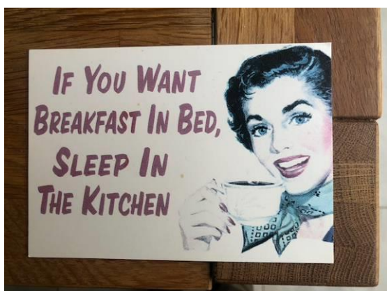
Bon sens britannique