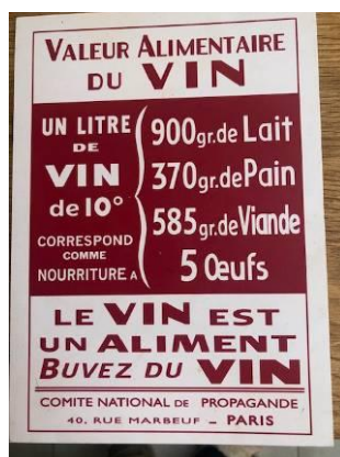
Bon sens français