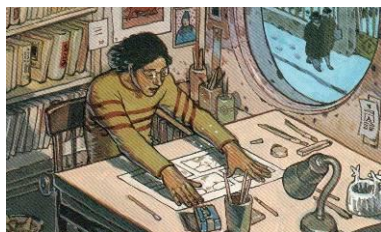
Rédacteurs en chef