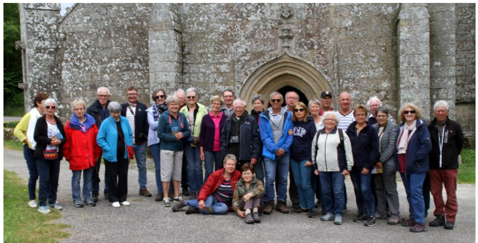
Devant saint Fiacre, photo-souvenir de la randonnée de ce printemps

Floréal n°81 Décembre 2019 Nature et Culture Maison des Associations Chemin des Garennes 85270 Saint Hilaire de Riez nec85270sthilaire@gmail.com www.natureetculture85.fr Direction de publication : B. Blanc-Richard, N. Boisseleau et F. Leminoux Rédacteur : J.-P. Bouffet