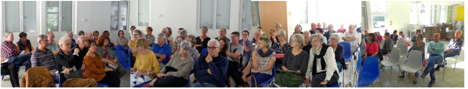
L'A. G. se termina autour de toasts et d'un verre amical avec la musique de No way back.