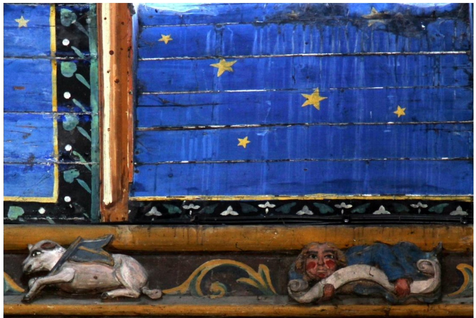
Sablère de l'église Saint Méline à Morlaix, Finistère

Floréal n°81 Décembre 2019 Nature et Culture Maison des Associations Chemin des Garennes 85270 Saint Hilaire de Riez nec85270sthilaire@gmail.com www.natureetculture85.fr Direction de publication : B. Blanc-Richard, N. Boisseleau et F. Leminoux Rédacteur : J.-P. Bouffet