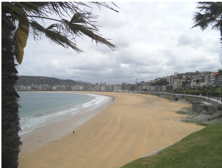
Igeldo et Urgull.

Après l'effort, nous arrivons en vue de la rade de Saint Sébastien. La descente très rapide vers le remblai nous permet de voir les trois plages : Concha, Ondaretta, Zurriola et les monts.