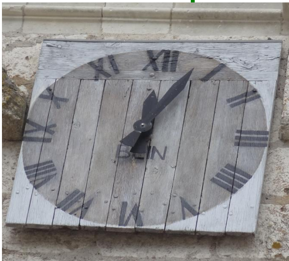
La pendule en bois du clocher de l'église de Saint Dyé sur Loire