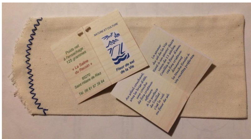
un sachet toilé et l'étiquette des sachets de fleur de sel