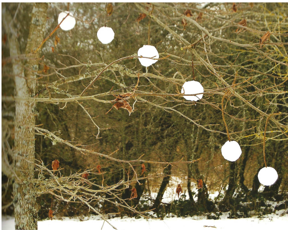
Boules de neige jouant les équilibristes dans les branches d'un jeune érable. Marc Pouyet

Floréal n°66 Décembre 2013 Nature et Culture 64 rue Georges Clemenceau 85270 Saint Hilaire de Riez Directeur de publication : Bernard Taillé Rédacteurs : des administrateurs Photos des adhérents